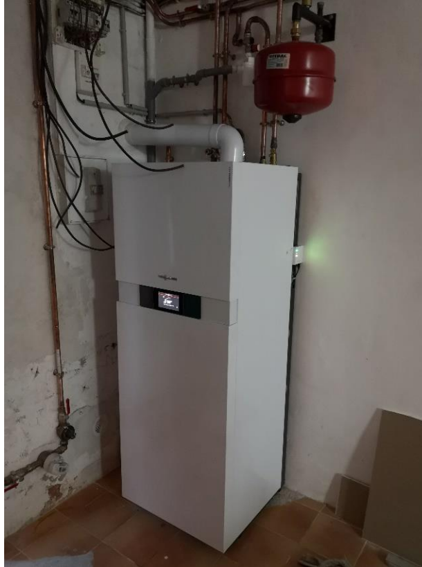
Chaudière à condensation au gaz de ville