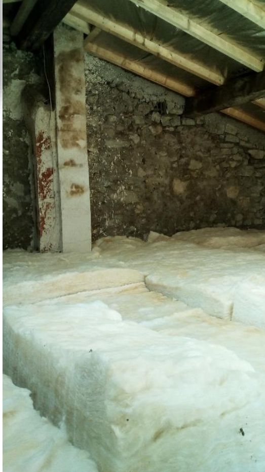
Isolant posé dans les combles, après la réfection de la toiture.