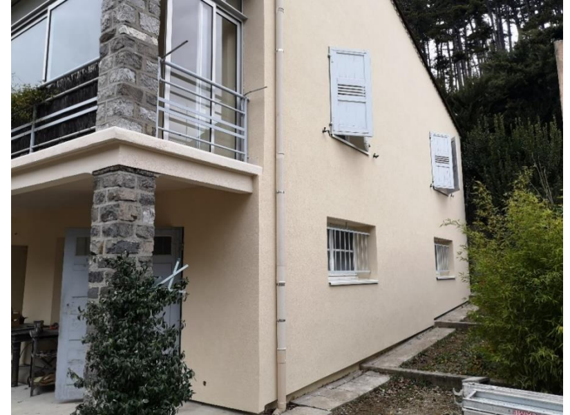
Isolation par l'extérieur d'une villa.