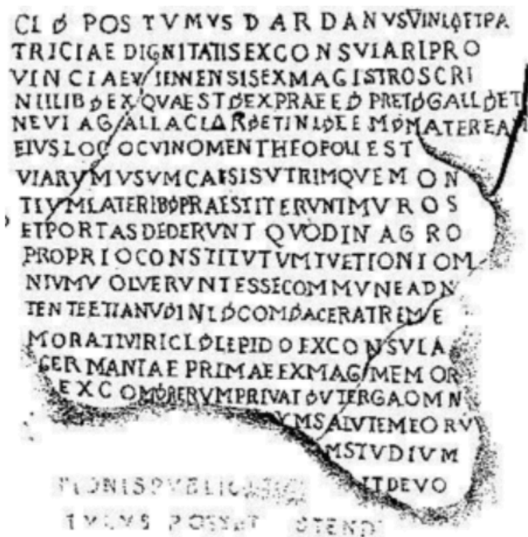
Calque du texte de Pierre Écrite

Claudius Postumus Dardanus, homme illustre, revêtu de la dignité de patrice, ex-consulaire de la province viennoise, ex-maître des requêtes, ex-questeur, ex-prêteur des Gaules, et Nævia Galia, noble et illustre dame, son épouse, ayant fait tailler les flancs de la montagne de chaque côté, ont donné des routes praticables au lieu nommé Théopolis, lieu qu'ils ont fortifié par des murs et des portes. Ce travail a été exécuté dans leur propriété particulière, mais ils ont voulu néanmoins qu'il serve à la protection de tous ; il a été fait encore avec l'aide de Claudius Lepidus, homme illustre, compagnon et frère du susmentionné, ex-consulaire de la province romaine, ex-secrétaire de la province de l'Empire, ex-intendant des affaires privées. Afin que leur sollicitude pour le salut de tous et un témoignage de la reconnaissance publique puissent être montrés par cette inscription.