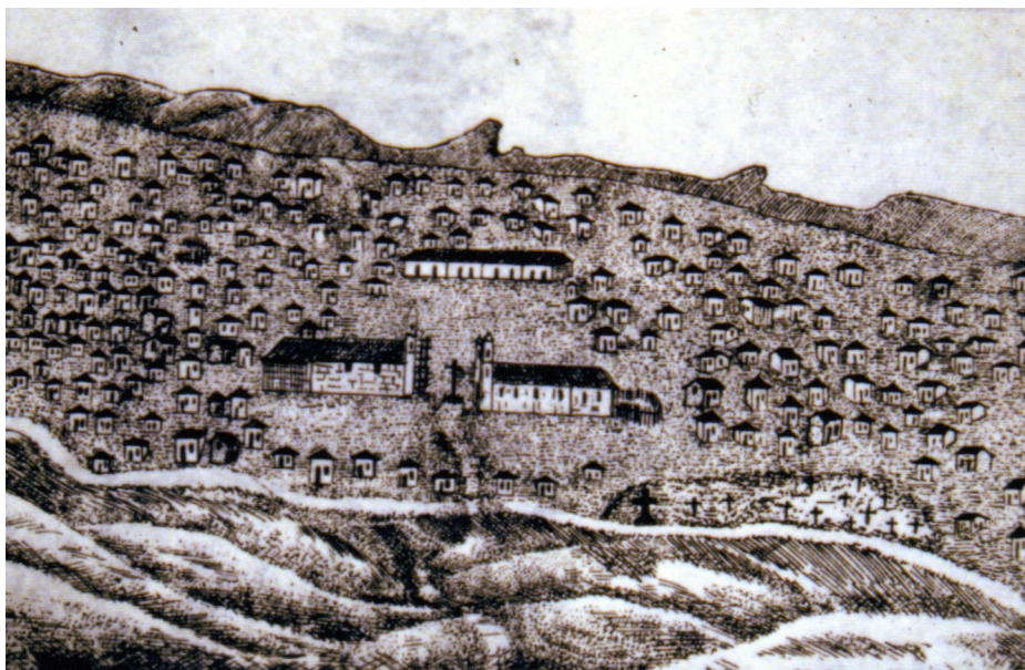
Canudos au moment de sa splendeur, gravure d'époque

Il y a sur l'affaire de Canudos, une très abondante littérature, car le politique a vite pris le dessus par rapport à la question spirituelle. Imaginez que les va-nu-pieds de Canudos ont infligé trois défaites retentissantes à l'armée brésilienne avant d'être écrasés par une mobilisation quasi générale des forces militaires du pays, patronné par le Ministre de la Guerre en personne. Logique de guerre, féroce question d'honneur. La cité de dieu, qui donc en aurait encore parlé, dans ce combat de forcenés, où seule la barbarie régnait à tous niveaux et dans chacun des deux camps.