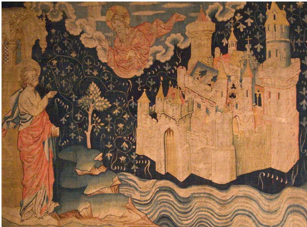
La Jérusalem céleste : tapisserie dite le l'Apocalypse (Musée d'Angers, XIV e s.)

On notera d'ailleurs que dans l'optique de la légende d'Amaro, le paradis terrestre découvert est inséparable de l'autre, puisque le gardien des lieux autorise Amaro à voir, mais lui interdit d'entrer. Il n'entrera de fait qu'après sa mort, qui est proche, puisqu'il se sépare alors définitivement de ses compagnons de voyage, après sa vision paradisiaque, synonyme de finitude.