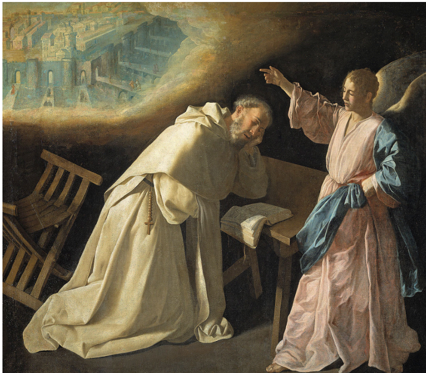
La Cité de Dieu selon Zurbarán ( La Vision de saint Pierre Nolasque , 1626, Musée du Prado, Madrid)