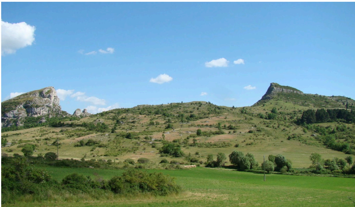
Le site grandiose des deux rochers de Dromon et Dromonet, en face de Saint-Geniez

En ce qui concerne Théopolis, tous les visiteurs, y compris les plus anciens, qui ont fait le voyage à cheval, ont été saisis par la beauté des sites qu'ils découvraient après avoir franchi le défilé de Pierre Écrite et l'échancrure de Chardavon, débouchant ensuite dans le site même de Dromon/Saint-Geniez