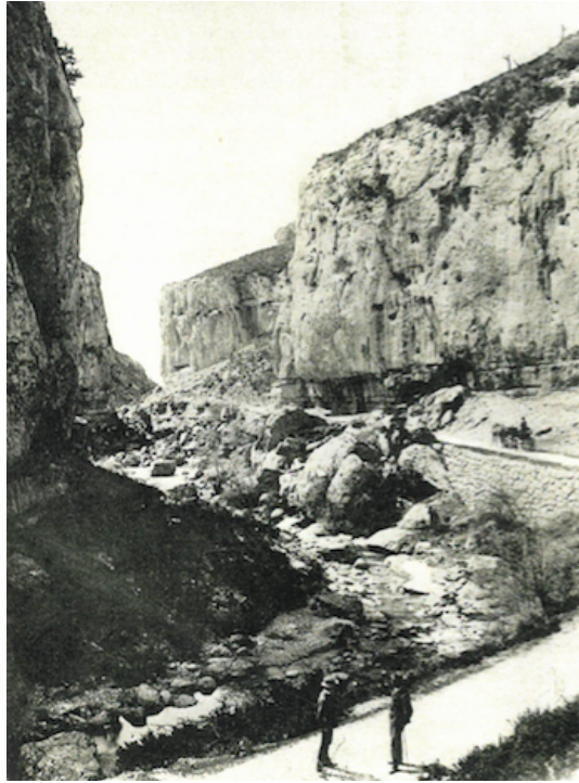
Photo ancienne du Défilé de Pierre Écrite (1908), reproduite par Philippe Nucho-Troplent (cf. Bibliographie)