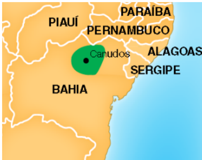
Situation de Canudos/Belo Monte, au Brésil

Toutefois, ce qui nous intéresse ici n'est pas le contexte historique, certes fondamental, mais la portée spirituelle et mythique de l'expérience de Belo Monte. Non seulement l'implantation sur les rives austères du Vasa Barris fut une extraordinaire réussite humaine, mais bientôt la «nouvelle Jérusalem» 11 du désert draina vers elle un nombre toujours plus important de «sertanejos», les ruraux dirait-on. Comme on le verra plus en détails, elle devint ainsi rapidement un péril pour la structure même de la société latifundiaire de l'intérieur du Brésil. Il se créait en effet, et vaille que vaille, une société christique égalitaire, ayant banni y compris la circulation de l'argent et remontant aux arcanes bibliques de Capharnaüm, sur les bords du lac Tibériade.