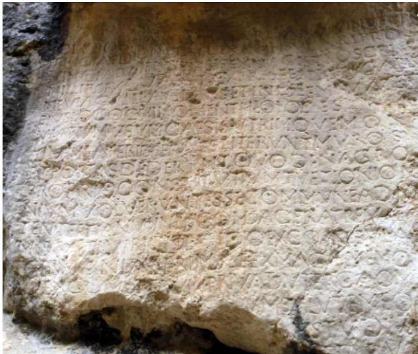
L'inscription de Pierre Écrite