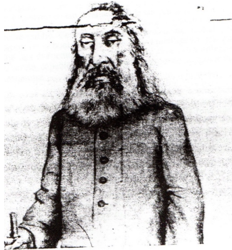
Portrait d'Antoine Maciel, gravure d'époque

À Canudos, Belo Monte, le mythe du Paradis espéré, ou entrevu, va se transfigurer en combat sans merci pour la plus élémentaire justice. Antoine, le Conseiller, et ses partisans sont morts pour leur foi... et pour la reconnaissance de leur dignité humaine.